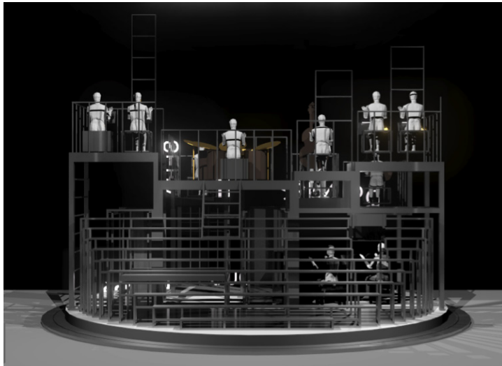
Vue du lointain du décor (chez les putains)

Le décor est placé sur tournette. L'orientation du décor permet de figurer les différents lieux de la pièce (la scène du « lupanar », par exemple, aura lieu décor orienté côté escalier).