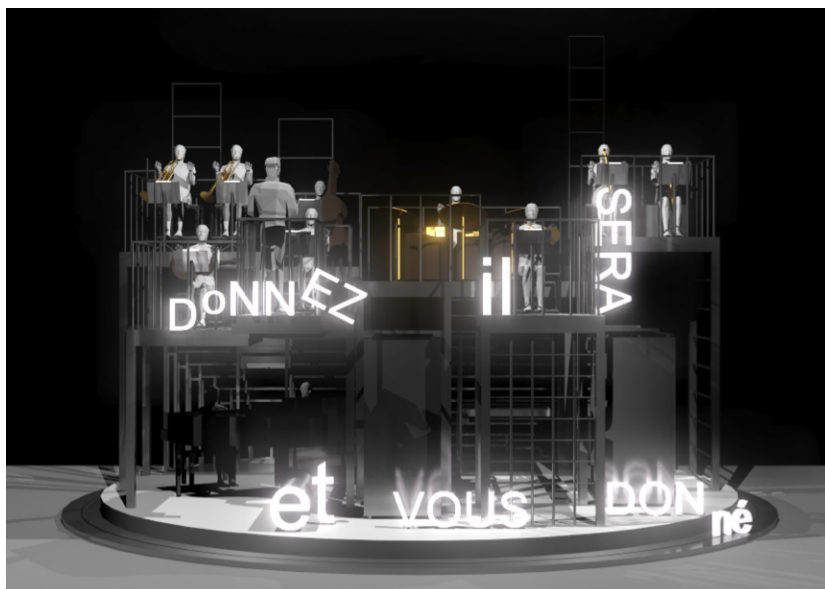
Vue de face du décor (chez Peachum)

Le spectacle est joué en musique, les musiciens accompagnent et interagissent avec les comédiens. Nous cherchons une relation nouvelle entre la musique en direct, le texte, le corps. La musique de Weill crée un climat d'illusions et de revendications. Elle peut en un seul song transformer les destins.