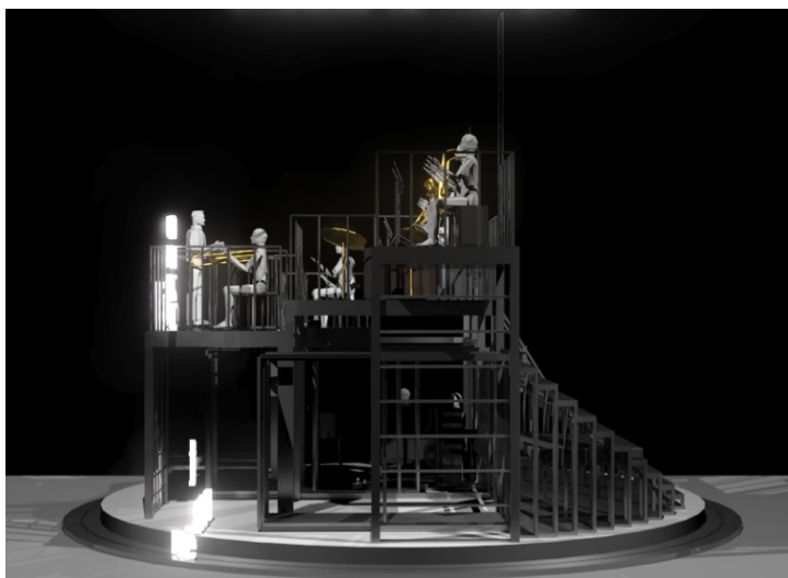
Vue de cour du décor (prison)